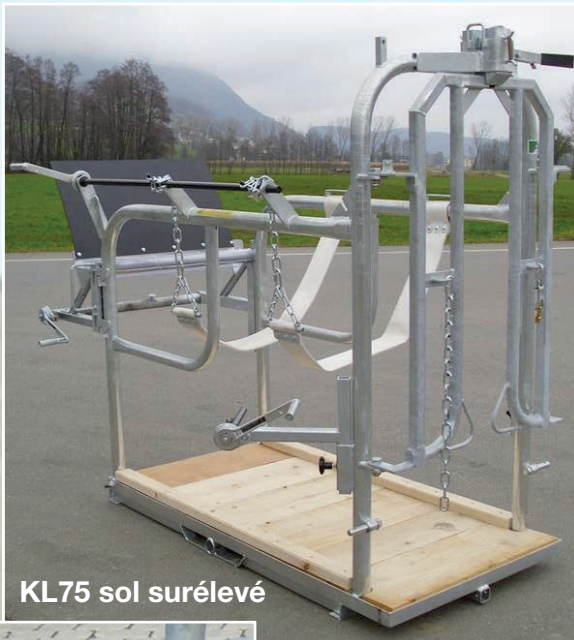
KL75 sol surélevé

Fässler Landtechnik Fässler Franz - Landmaschinenbau Chelen 8 CH-9466 Sennwald Produktion: Industriestr. 2, 9464 Lienz Tel. 071 766 25 53 Lienz Fax 071 766 25 54 Lienz info@faessler-landtechnik.ch www.faessler-landtechnik.ch