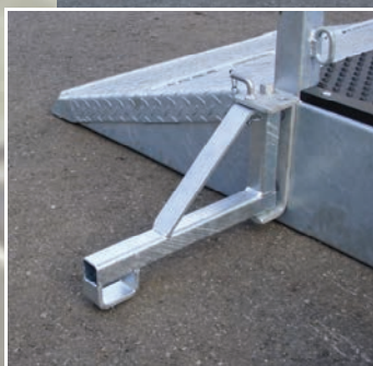
béquille d'appui (en option)

Possibilité de réglage des treuils pour pattes de devant L 80 mm, H 80 mm Possibilité de réglage des treuils pour pattes derrières L 80 mm, H 80 mm