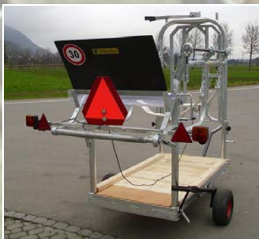
éclairage (en option)