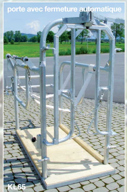
porte avec fermeture automatique