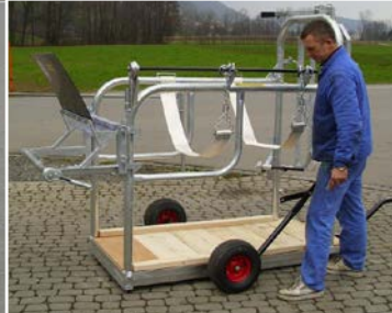
Axe de marche avec timon introduisible (sur option)