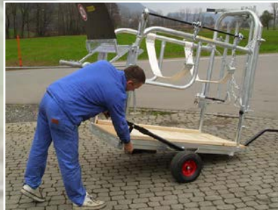
Accessoire sur option KL 65/75 Treuils variable pour pattes de devant Cuve à crotte Axe de marche avec timon, Eclairage