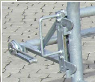
Fermeture double de série