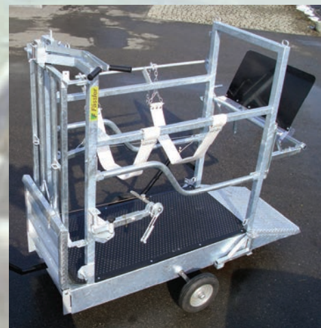
Accessoire: Installation de transport

Installation de soins pour sabots, Fond surélevé permettant travailler en position debout. Sortie au moyen d'une rampe pliable. Grille automatique réglable pour faire rentrer les animaux. Porte arrière avec fermeture automatique. Cuve à crottes synthétique intégré dans la porte. Treuil de houlage pour pattes de devant, réglable dans la hauteur et la longueur, fermeture automatique. Treuil de houlage pour pattes derrières réglable dans la hauteur et la longueur. Fond matelassé. Toute l'installation galvanisée